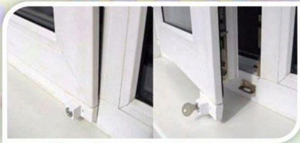
Замок блокировщик с ключом

Можно воспользоваться специальными замками блокираторами, которые предлагают установщики пластиковых окон.