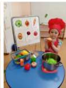
Варим вкусный полезный компот из фруктов