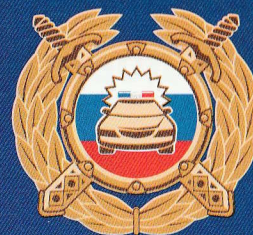
Госавтоинспекция МВД России

Буклет изготовлен по заказу Минпросвещения России в рамках реализации федеральной целевой программы «Повышение безопасности дорожного движения в 2013–2020 годах».